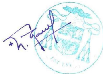
+ Luc RAVEL Evêque aux Armées