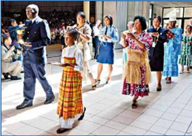
Procession des offrandes

Notre amour va d'abord vers le pauvre. Jésus l'enseigne par sa pratique et la doctrine de l'Eglise le répète : « la charité est un amour préférentiel pour les pauvres ». Oui, il y a une préférence dans l'amour qui vient de Dieu : une pente naturelle vers le pauvre. Quels sont les pauvres ? L'Evangile parle