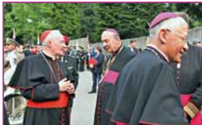
Le PMI est un lieu où se manifeste la fraternité épiscopale des évêques aux armées.

Il est « étonnant » de par cette belle participation internationale et par cette communion et cette fraternité extraordinaire entre les différentes nations et