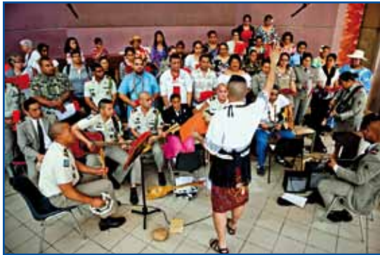
La messe nationale d'ouverture était animée par des militaires originaires des Iles du Pacifique. Leur train de nuit ayant un subi un retard de 4 heures, ils ont du courir à leur arrivée en gare vers le lieu de la cérémonie. La qualité de l'animation, mûrement préparée pendant l'année, n'en a pas souffert en témoignage l'enthousiasme de l'assemblée à l'issue.

une personne peut nous faire chuter. Trop d'affectivité peut brouiller notre discernement de pasteur voire notre diagnostic de médecin. Cette méfiance est parfois enseignée comme une prudence : les déviances existent : elles ne justifient pas une attitude en contradiction avec l'Évangile. « Il nous faut prendre et reprendre le risque d'aimer », nous disait le bienheureux Jean-Paul II. Viendrait-il à l'esprit de l'un d'entre nous de dénoncer trop d'amour chez une maman ? Nous pouvons mal aimer, certes, mais cela n'excuse rien puisque Jésus s'offre en modèle de notre amour : « comme je vous ai aimés... »