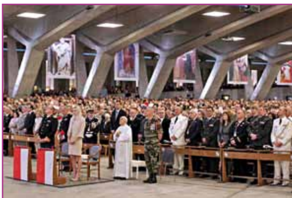
Au premier rang, le prince Albert de Monaco, chef de l'armée monégasque et la princesse Charlene revêtue de la mantille portée jadis par la princesse Grâce. Comme les autres pèlerins, le prince Albert apprécie la qualité des grands écrans qui retransmettent la liturgie