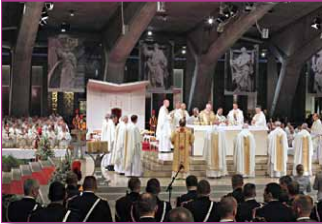
Le cardinal Ouellet, préfet de la Congrégation pour les évêques, concélébrerait la messe internationale avec une large représentation du corps des évêques aux armées

2) La fidélité est la preuve de l'amour. Elle est la plus authentique preuve du véritable amour. « Si vous m'aimez, dit Jésus, vous garderez mes